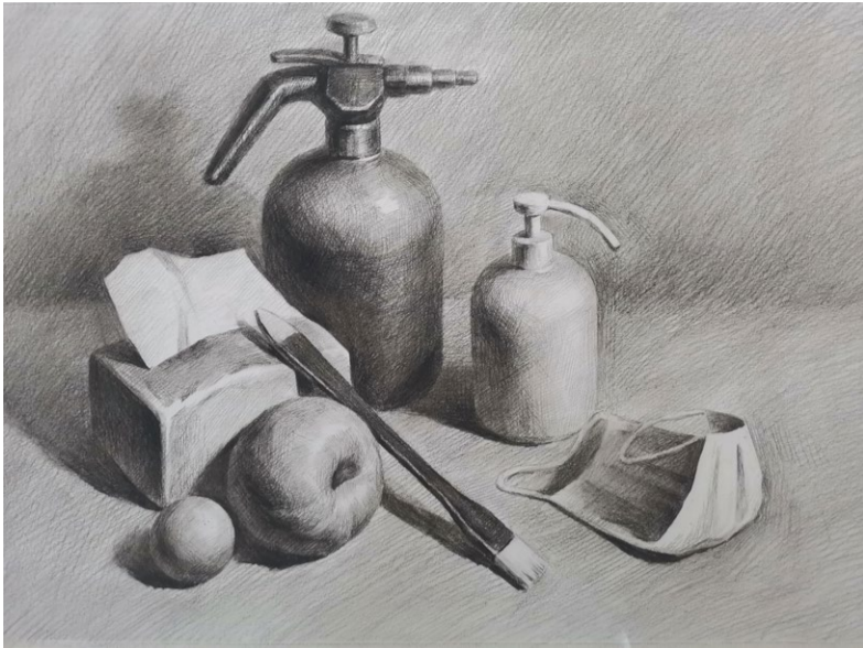
《防疫进行时》素描 教师：孙建国