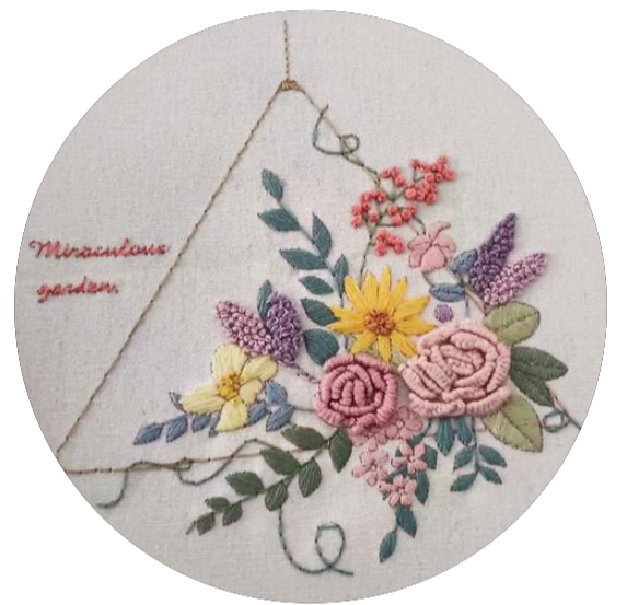
《花园》鲁绣 学生：李文慧 指导教师：张欣