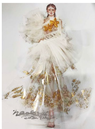
创意立体时尚插画 学生：王学艳 指导教师：孟晓