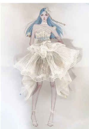
创意立体时尚插画 学生：袁冰雁 指导教师：孟晓