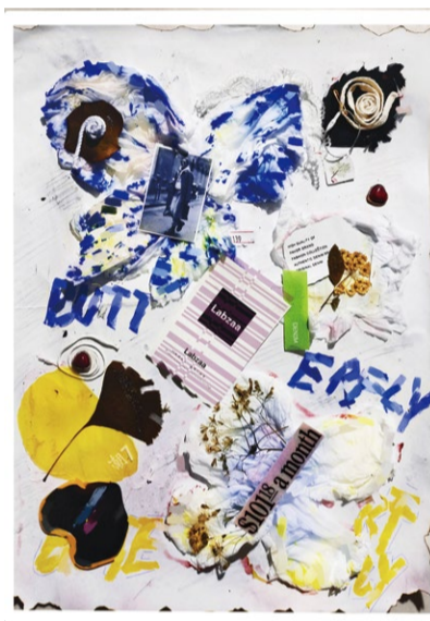
Blue butterfly 装饰画 学生：白云梦 指导教师：景婷婷