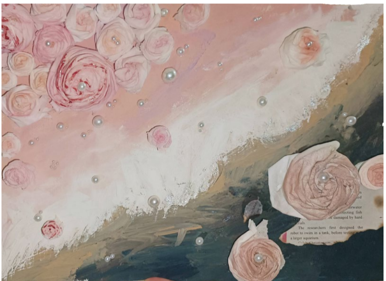
《绽放的鲜花》装饰画 学生：房全慧 指导教师：刘亚楠