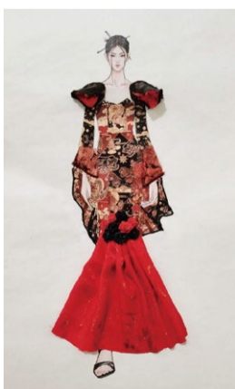
创意立体时尚插画 学生：谢琳娜 指导教师：孟晓