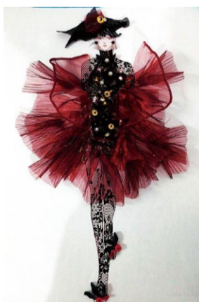
创意立体时尚插画 学生：程子莹 指导教师：孟晓