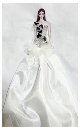
创意立体时尚插画 学生：杨鑫淼 指导教师：孟晓