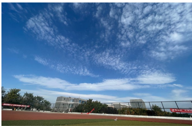
《校园风景》摄影 学生：路志浩 指导教师：高楠