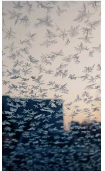
《内外》摄影 教师：徐国梁