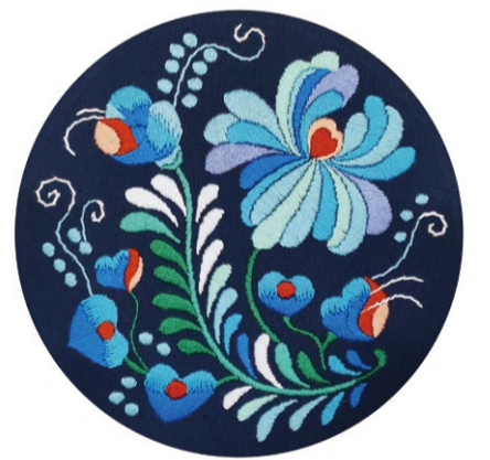
《轻舞飞扬》刺绣 学生：张茜 指导教师：董如雪