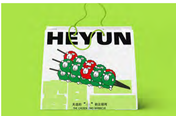
《鹤云 淄博烧烤 x 系列包装-1》 包装设计 学生：田瑾 指导教师：樊帅君