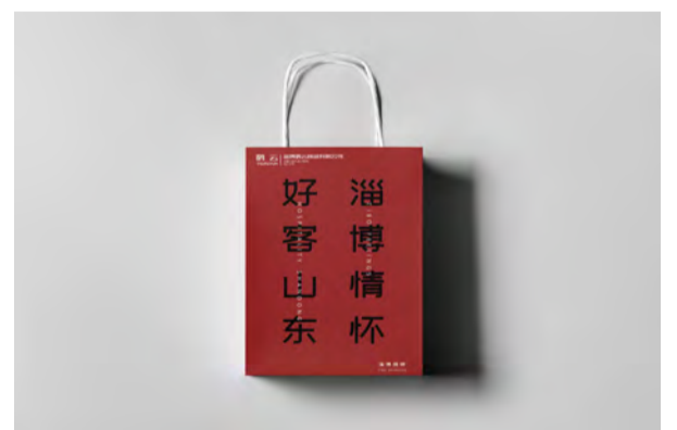
《淄博烧烤系列包装-2》包装设计 学生：沈泽 指导教师：张苗苗