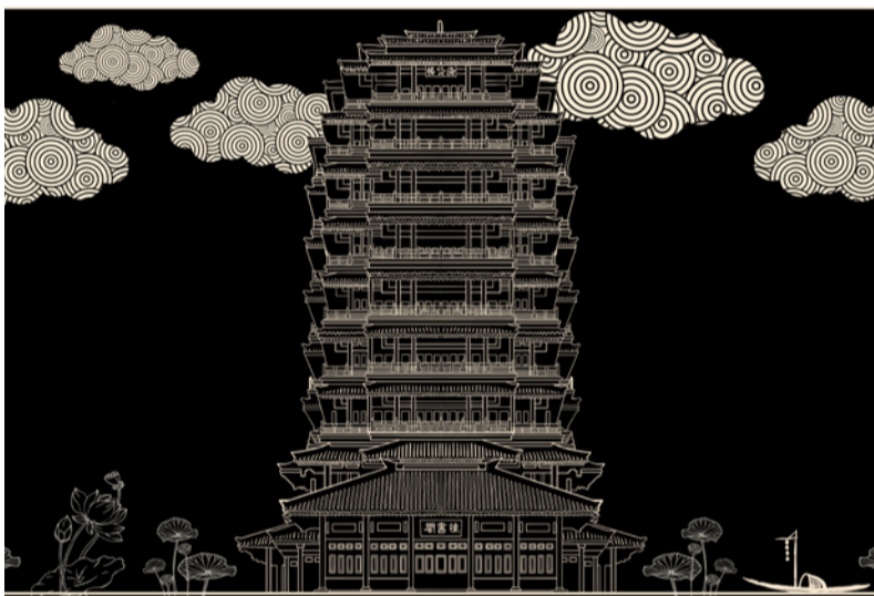
《海岱楼》版画 学生：沈泽 指导教师：翟倩倩