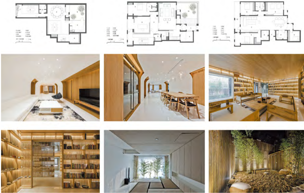
《别墅设计平面图、效果图》室内设计 教师：石峰