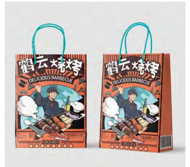
《鹤云 淄博烧烤包装》包装设计 学生：陈宝琪 指导教师：樊帅君