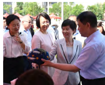
淄博市政府副市长毕红卫、淄博市政协副主席、淄博市中华职教社主任马靖参观教展区

本次职业教育活动周展览集职教方针政策宣传，制造强国、乡村振兴、人人出彩、数字经济成果展示，优秀文化进校园、校园开放日等于一体，重点围绕“技能成就出彩人生”、“技能服务美好生活”，多维度展示我市职业教育改革成果、典型经验和职业教育风采，让更多人感受职教改革硕果累累、职教界人才辈出，精彩不断的“职教魅力”，让社会各界更好地体验技能给生活带来的美