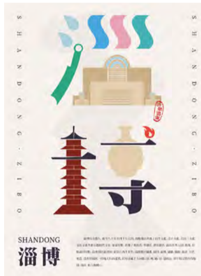
《淄博城市海报》招贴设计 学生：孟祥城 指导教师：刘飞