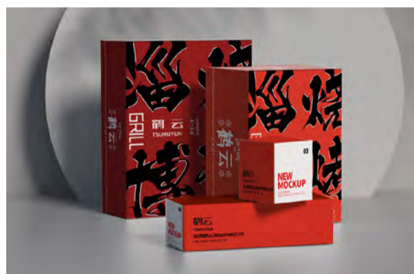
《淄博烧烤系列包装-1》包装设计 学生：沈泽 指导教师：张苗苗